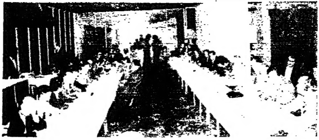
التدويع بمنقطة في الكتلون